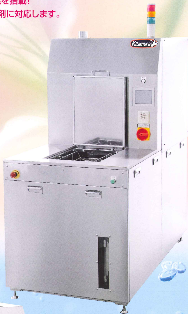
Type 1 : KAA-MA-1-M型