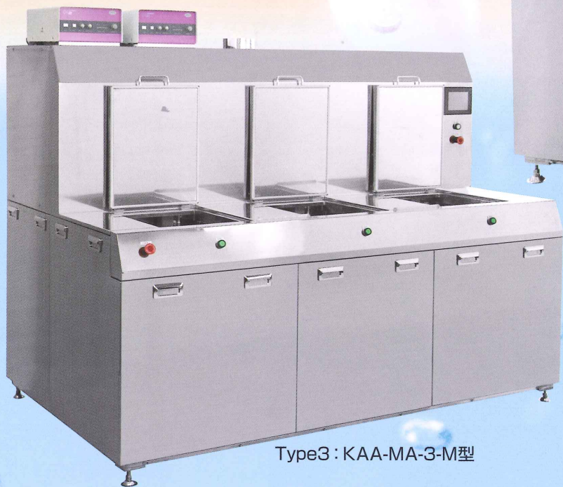
Type 3 : KAA-MA-3-M型