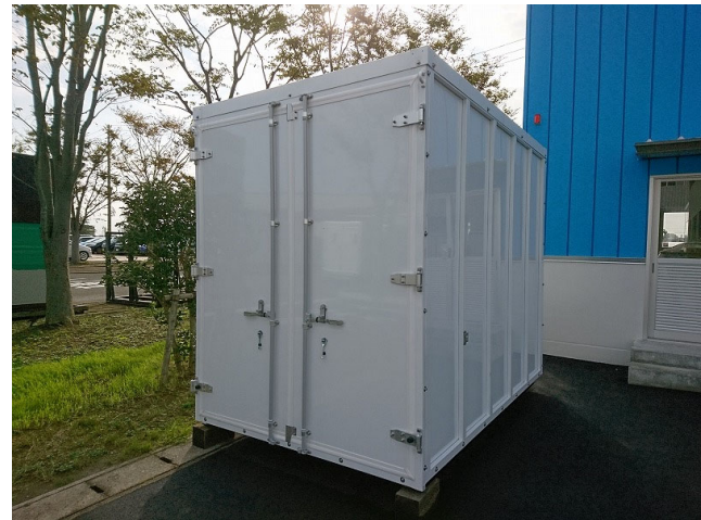
試作検証(コンテナ外観)

オプション品：①簡易断熱追加 ②ベンチレータ追加 ③ガラリ追加 ④25cm換気扇追加