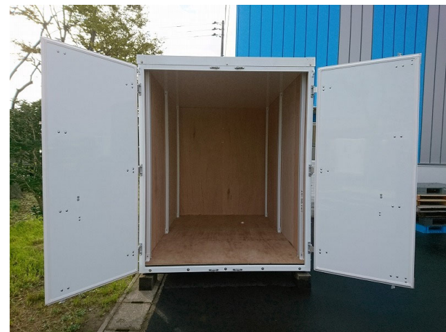
試作検証(コンテナ室内)